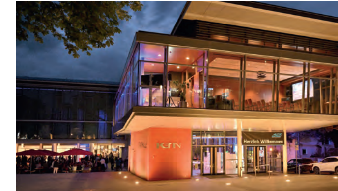
Stand: 28. Mai 2026

Ca. 20 km vom Flughafen Stuttgart entfernt Taxi (max. 4 Personen) ca. 55 € Ca. 25 km von Stuttgart Ca. 3 km zur A8 (Auffahrt Wendlingen-Nürtingen) 3 Min. Fußweg vom Bahnhof Nürtingen