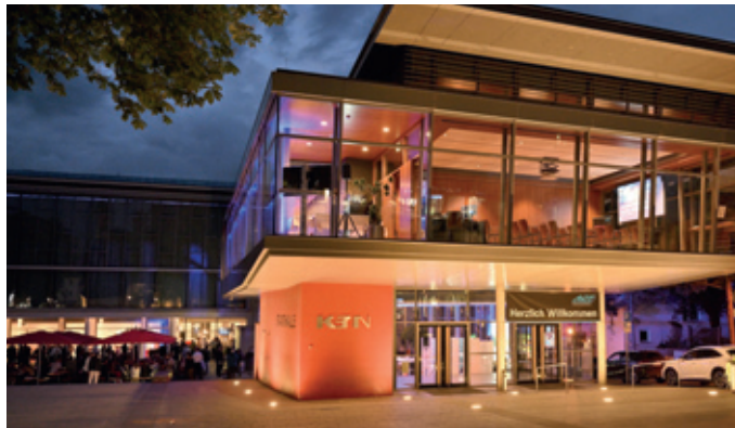
Stand: 15. Dezember 2025

Ca. 20 km vom Flughafen Stuttgart entfernt Taxi (max. 4 Personen) ca. 55 € Ca. 25 km von Stuttgart Ca. 3 km zur A8 (Auffahrt Wendlingen-Nürtingen) 3 Min. Fußweg vom Bahnhof Nürtingen