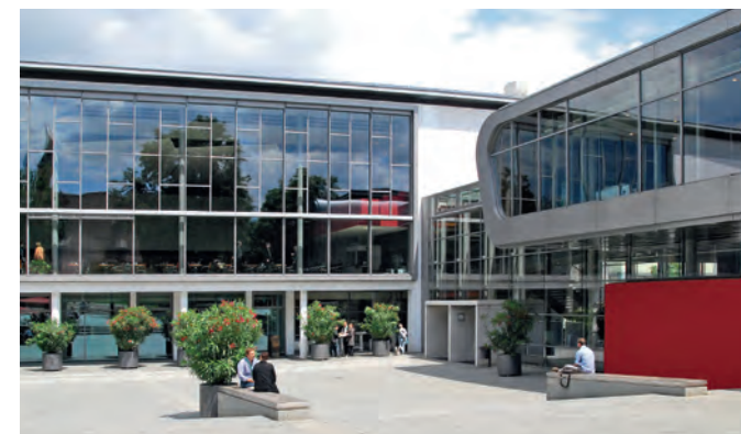
Stand: 13. Januar 2020